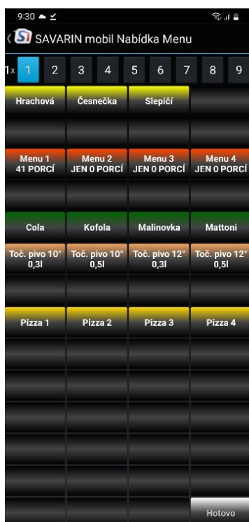
14x4 řádků - 56 tlačítek