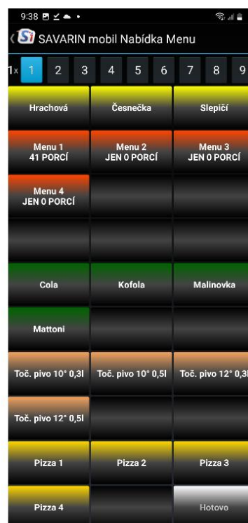
10x3 řádků - 30 tlačítek

Nové rozložení tlačítek lze nastavit pouze na Pokladně v „Opravy a servis“ – „Tlačítka rychlé volby pro mobilního číšníka“. Tam si vyberete některou z uložených hlaviček zálohy. Tlačítkem „Nastavení nabídky“ se objeví okno s jednotlivými Top tlačítky. Po zvolení tlačítka „Přejmenovat nabídky, Poznámka, Rozložení tlačítek“ se Vám mimo jiné zobrazí i možnost „Rozložení tlačítek“.