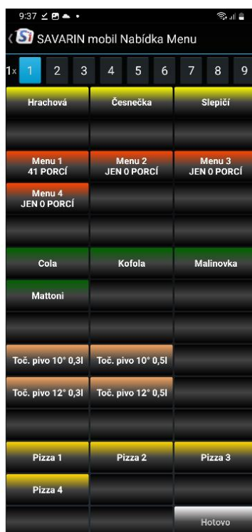
14x3 řádků - 42 tlačítek